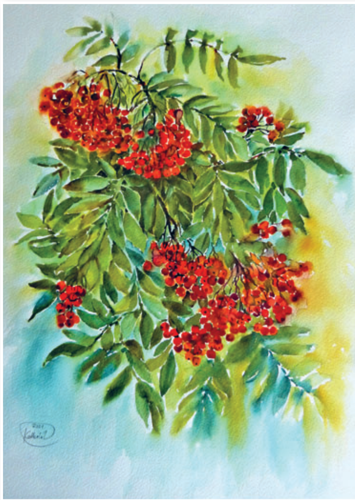
Vogelbeeren, 30x40 cm

Aquarelle von Kathrin Voigt aus Dorfhain