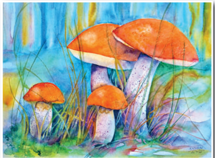
Rotkappen, 30x40 cm