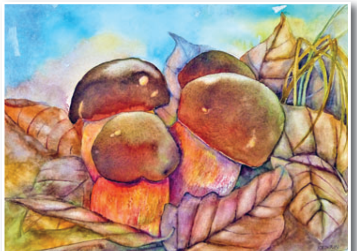
Kleines Quartett, 30x40 cm