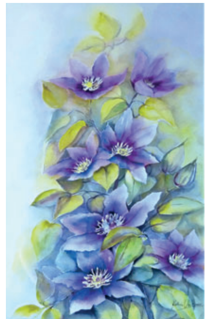
Clematis 40x60 cm