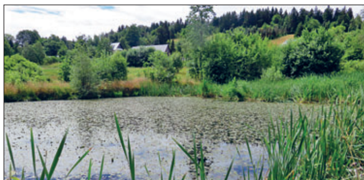
Foto: LPV - Naturnaher Teich mit Schwimmblattvegetation und Röhricht

Der Zustand der Stillgewässer im ehemaligen Weißeritzkreis wurde in den Jahren 2019 bis 2022 systematisch erfasst und in Steckbriefen festgehalten. Auf dieser Grundlage sind nun verstärkte Sanierungsmaßnahmen an den Gewässern Ziel des laufenden Projektes. Diese sollen der Erhaltung und Entwicklung von Stillgewässern als wichtige Biotope für die heimische Flora und Fauna, insbesondere als Lebensraum und Laichgewässer für seltene, z. T. gefährdete Amphibienarten dienen.