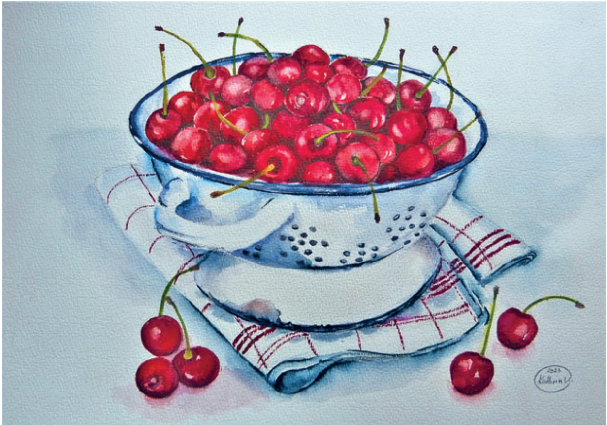
Süße Ernte 40x40 cm

Aquarelle von Kathrin Voigt aus Dorfhain