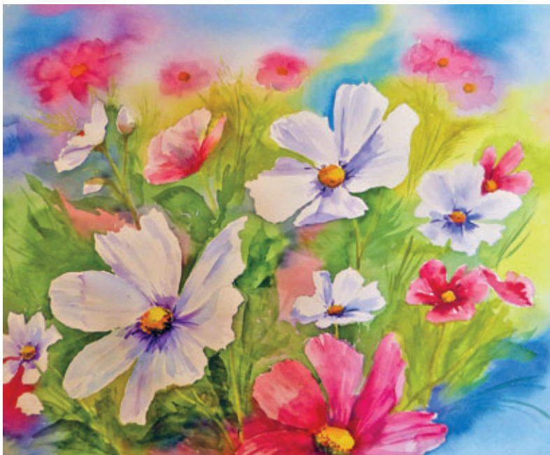
Cosmea 30x45 cm